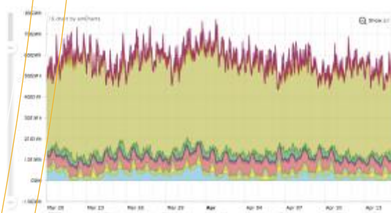
Graphique WattStrat issu de la plateforme web – Mix énergétique français horaire en 2015